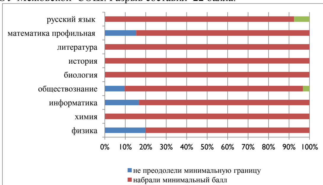
Рис. 3. Общие показатели результатов ЕГЭ 2016

Аналогичная ситуация в отношении разрыва между лучшими и худшими образовательными результатами и по русскому языку. Наивысший средний балл 71,00 в Среднеагинской СОШ, наименьший балл 49,00 в МКОУ Межовской СОШ. Разрыв составил 22 балла.